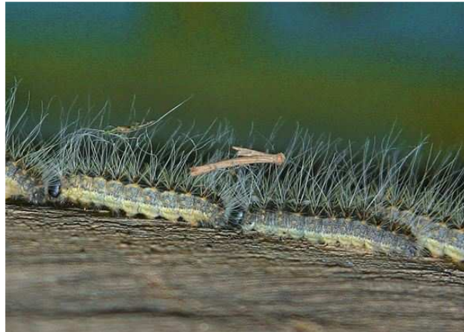
Raupen des Eichenprozessionsspinners