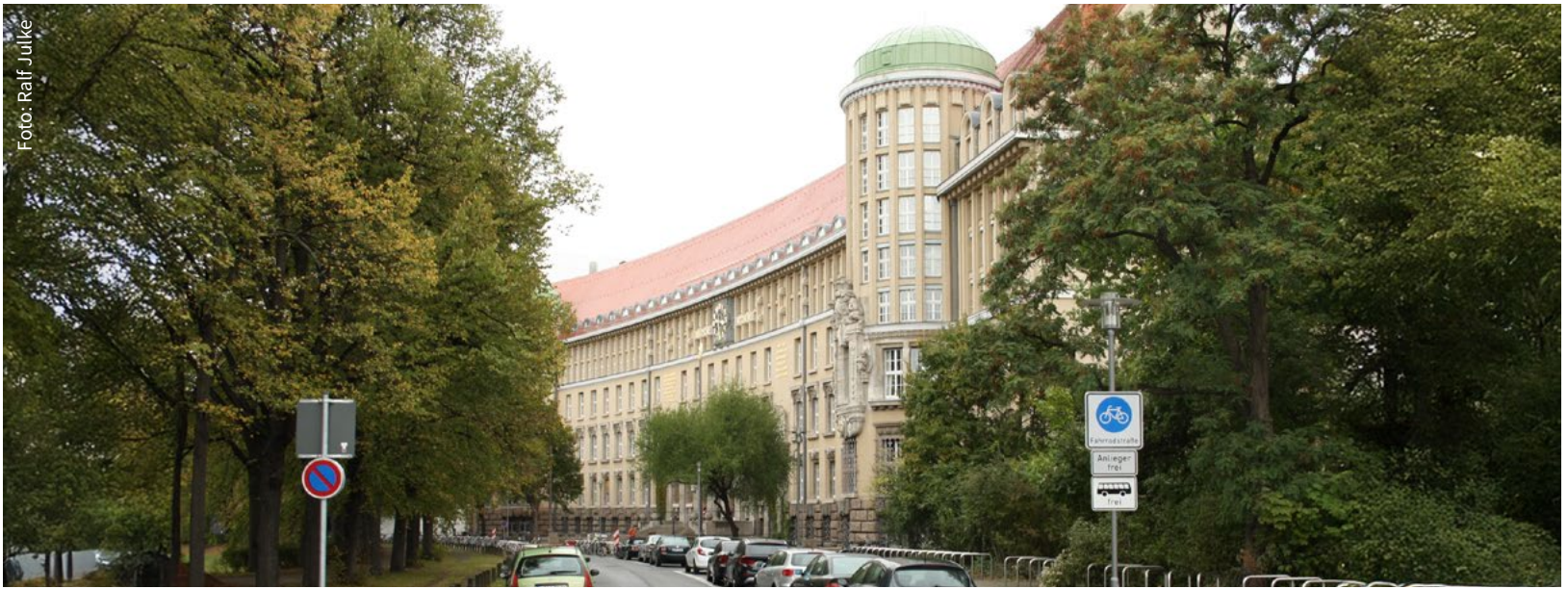
Die Deutsche Nationalbibliothek am Deutschen Platz in Leipzig.

Sachsen), betonte am Dienstag, 17. März: „Die DNB ist das nationale Gedächtnis, fördert mit ihren Diensten und Angeboten die Informations- und Meinungsfreiheit und stärkt somit zentrale Werte unserer demokratischen Gesellschaft.“