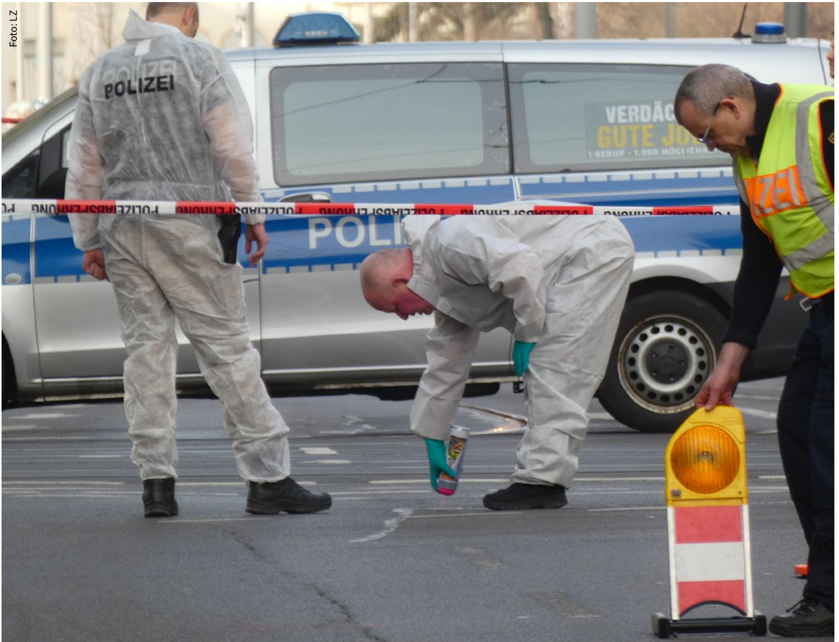
Die Kripo ermittelt zur Stunde vor Ort und sichert Spuren.