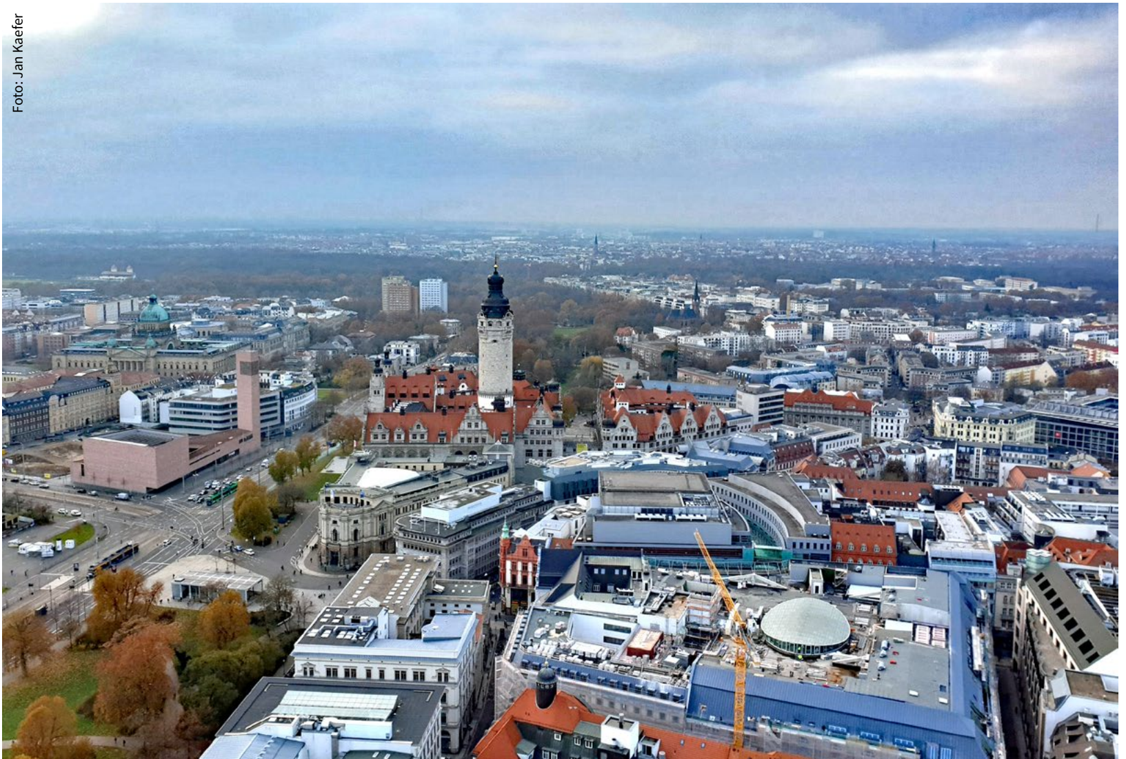
Neues Rathaus im Herzen von Leipzig