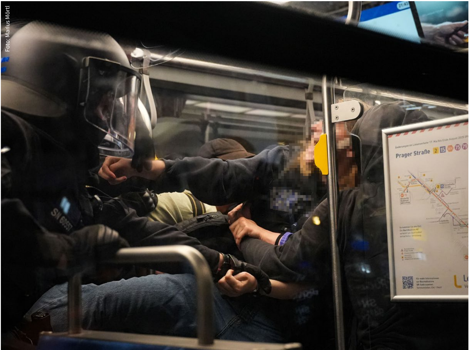
Blick durch die Türscheibe in den Innenraum der Straßenbahn.

Bahn sprüht. Getroffen werden die noch verbliebenen, eingehakten Personen.