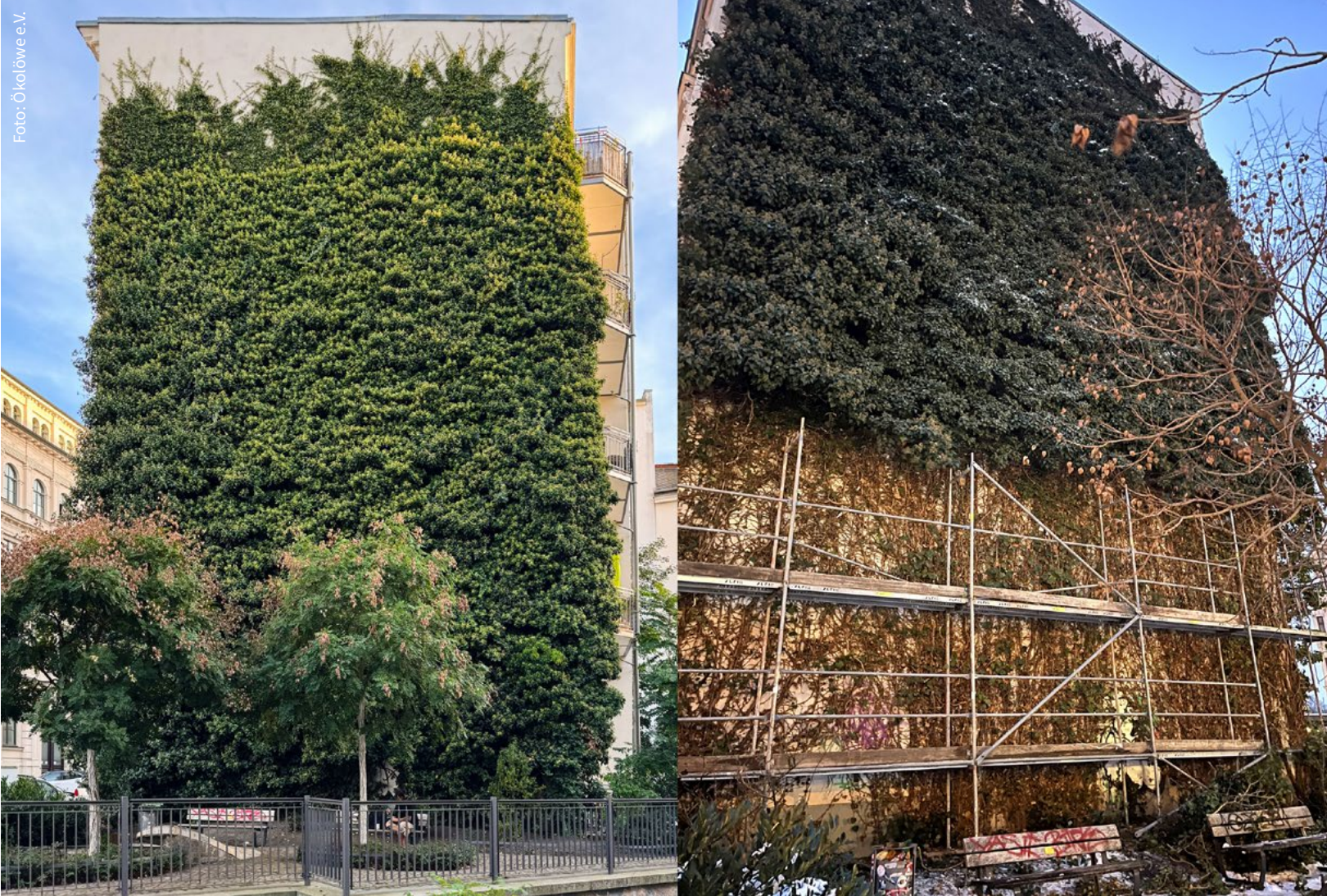
Die Zerstörung der Fassadenbegrünung in der Thomasiusstraße im Vorher-Nachher-Vergleich.

E nde Januar sorgte die Zerstörung eines die ganze Fassade bedeckenden Efeus an der Thomasiusstraße 6 für helle Aufregung. Nicht nur beim Ökolöwen, der postwendend Anzeige erstattete. Die Fraktion von Bündnis 90/Die Grünen stellte gleich eine Anfrage für die Februar-Ratsversammlung. Was wusste die Stadt über den Vorgang? Und warum ist sie nicht eingeschritten?