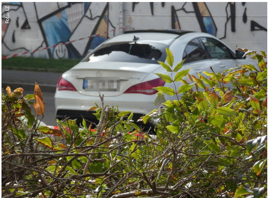
Der mutmaßliche Fluchtwagen wurde fahrerlos und mit kaputter Heckscheibe in der Nähe sichergestellt.

Update 11. März: Wie Polizei und Staatsanwaltschaft an diesem Tag mitteilten, habe sich das zu kontrollierende Fahrzeug in stadtauswärtiger Richtung an der Ampelkreuzung Hermann-Liebmann-Straße/Eisenbahnstraße befunden. Der betroffene Polizist (41) habe an der Fahrerseite gestanden, als der Mercedes sich während der Kontrolle wieder in Bewegung gesetzt habe. Der Polizist sei dabei touchiert und leicht verletzt worden.