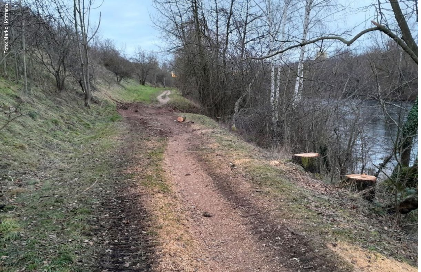
Der bislang nicht ausgebaute Deichweg am Elster-Saale-Kanal.

D rei Jahre später, acht Jahre später: Auch die Radfahrer, die sich eigentlich seit 2022 auf den neuen Radweg am Elster-Saale-Kanal gefreut haben, erleben eine Enttäuschung nach der anderen. Aber diesmal scheint es vor allem der bürokratische Papierkrieg zu sein, der dafür sorgt, dass der einst angekündigte Baubeginn 2022 schon nicht gehalten wurde und der Umsetzungstermin 2025 auch ins Wasser fiel. Auf eine Einwohneranfrage hin musste das Amt für Stadtgrün und Gewässer nun zugeben, dass man jetzt erst für 2030 mit einem Bau des Radweges rechnet.