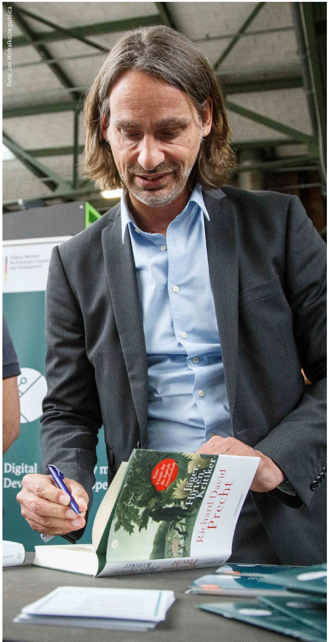
Schreibmaschine: Richard David Precht auf der re:publica 2018 beim Signieren eines seiner Bücher. Die re:publica ist eine der weltweit wichtigsten Konferenzen zu den Themen der digitalen Gesellschaft.

Für eine linksliberale Perspektive ist das eine unbequeme Einsicht. Denn sie zwingt dazu, die eigenen Diskursformen zu hinterfragen. Wo wird berechtigte Kritik zur moralischen Selbstvergewisserung? Wo wird aus Sensibilität, notwendiger Verteidigung und Inschutznahme eine Form von Paulschalangriff und Generalverdacht? Und wo verhindert die Angst, auf der „falschen“ Seite zu stehen, eine offene Debatte? Das klingt unspektakulär – fast schon altmodisch. Aber vielleicht liegt genau darin die eigentliche Radikalität dieses Buches. In einer Zeit, in der Lautstärke oft mit Relevanz verwechselt wird, besteht der eigentliche Mut darin, leiser zu werden. Nicht gleichgültig, sondern genauer. Nicht ängstlich, sondern differenziert. Damit eines abschließend klar ist: Straftatbestände bleiben auch solche. Die Verletzung von Persönlichkeitsrechten gehört ohne Zweifel dazu. ■