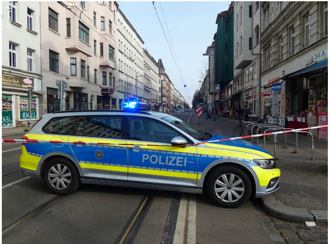
Ein Teil der Eisenbahnstraße wurde am Dienstag voll gesperrt und der Verkehr umgeleitet.

Aktuelle Informationen dazu gab es auf der Website der Leipziger Verkehrsbetriebe.